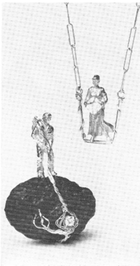
Deux pendentifs caractéristiques de Mazlo : de gauche à droite, « Astéroïde », en or, météorite et brillant ; « La vestale au diamant », portant un diamant brut.

Le bijou se fraye un chemin qui, sans le détourner de son but premier — parer la femme — ne cesse de l'élever au rang d'art majeur : l'art de la bijouterie et de la joaillerie trouve une vie nouvelle.