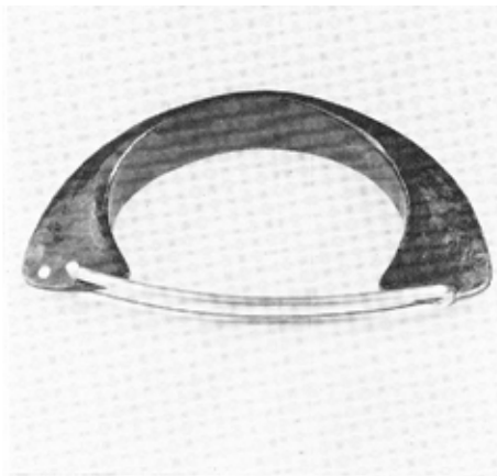
Mélange de force et d'élégance, ce bracelet en or jaune et fer d'une conception nouvelle plaira à la femme d'avant-garde (Yann Denez, Paris).