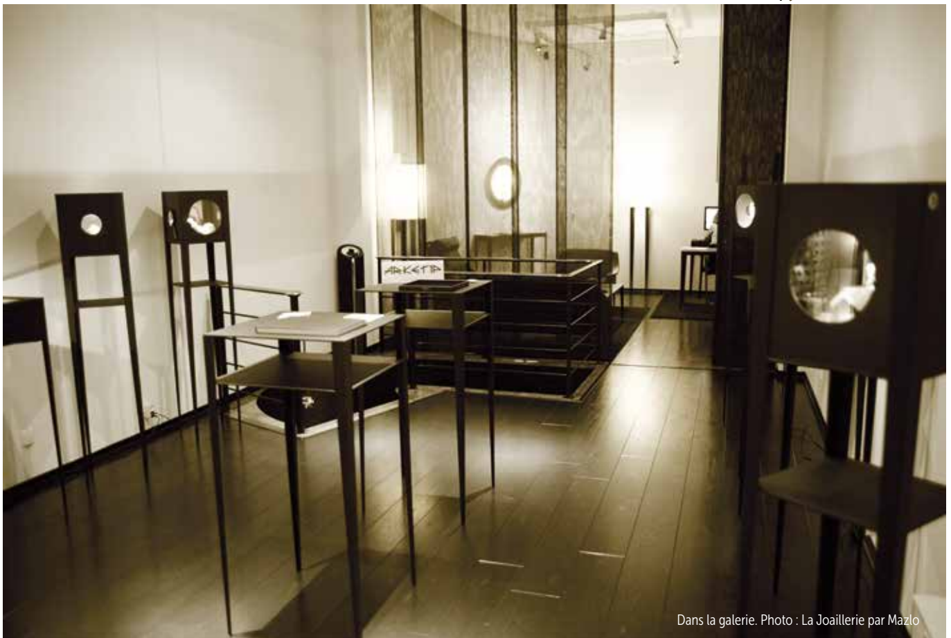
Dans la galerie.